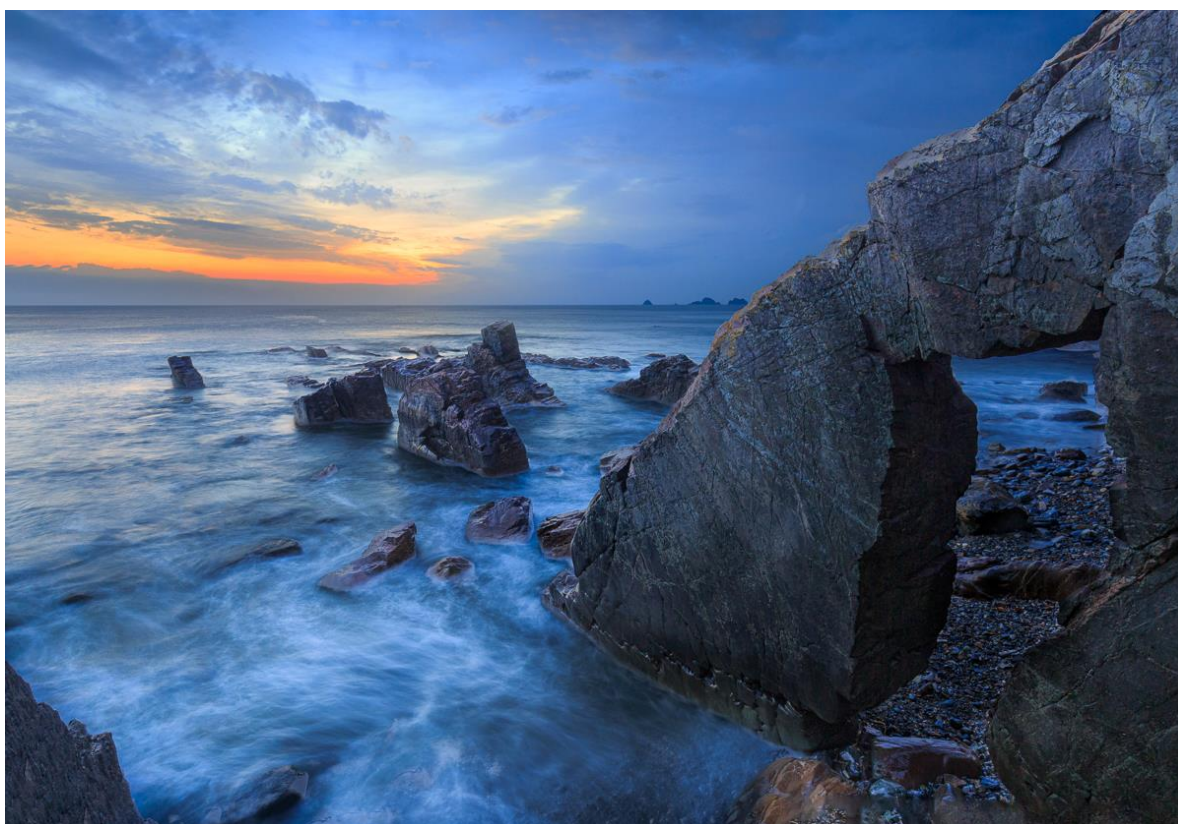
Fusion manuelle de deux expositions dans Photoshop (pose de 2,5 sec pour les vagues + pose de 20 sec pour les rochers)