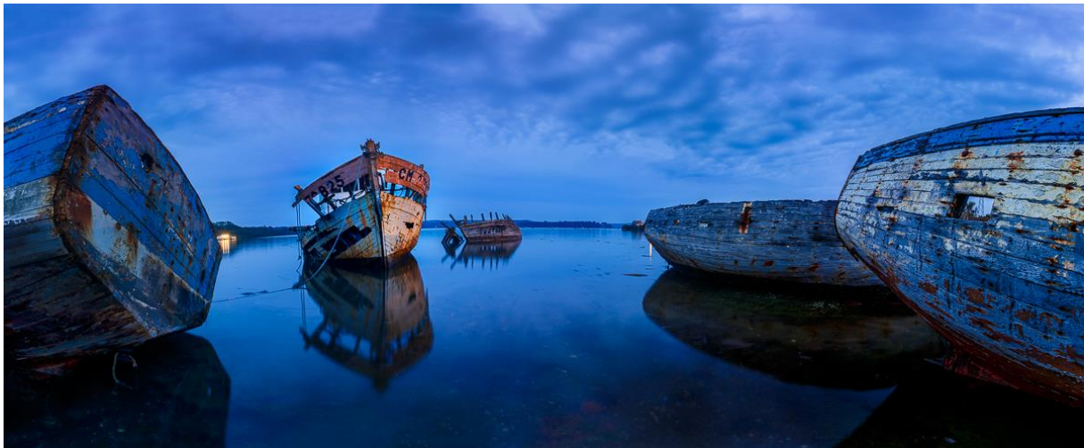
Panoramique à l'heure bleue : assemblage de 7 photos à 180°. Photo réalisée trépied dans l'eau, après repérage et photo test en journée à marée basse.