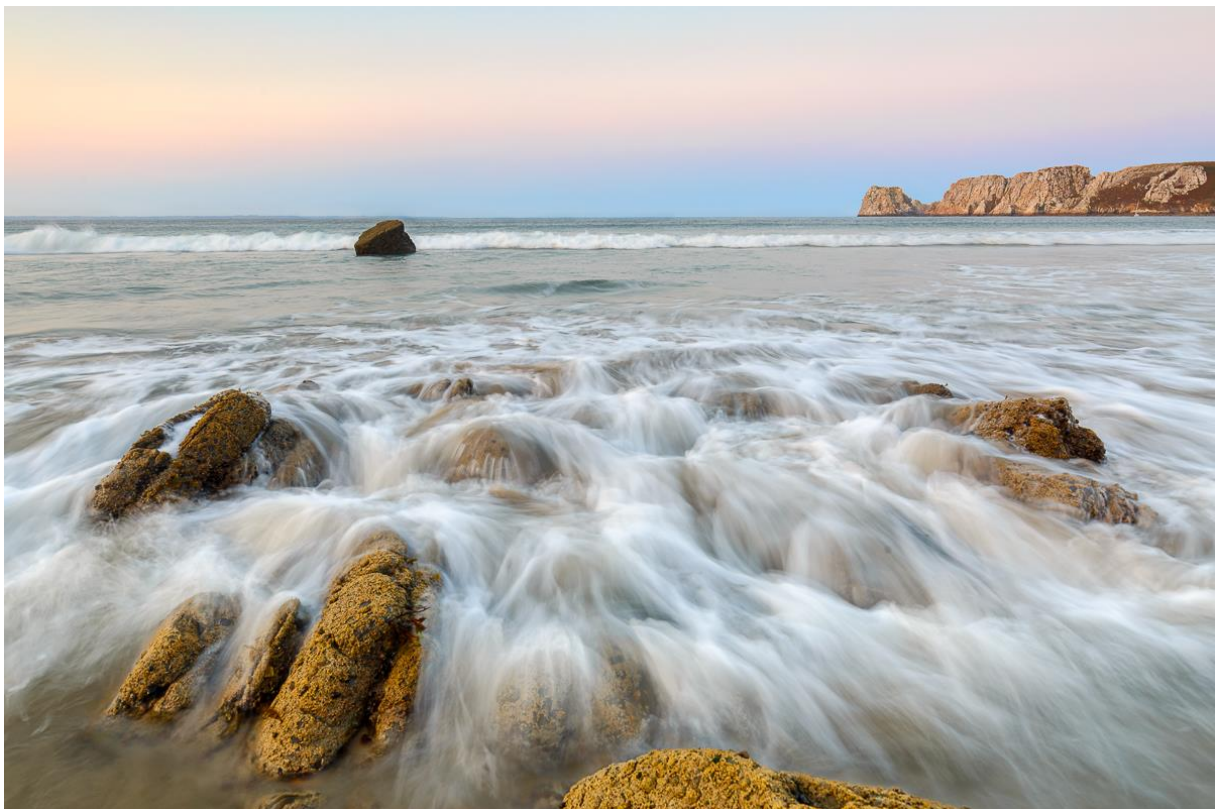
Pose longue de 0,3 sec, filtre gris neutre et filtre gris dégradé

Petit plus : vous pouvez si vous le souhaitez amener une petite spécialité de votre région à partager !